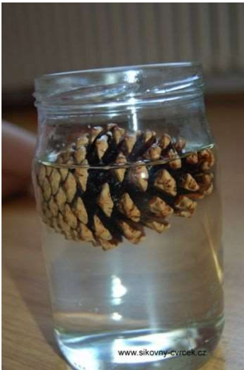
Pokus se šiškou